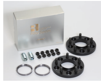
Ⓐ RHCS 5mm 5-114 73.1BK 2P Ⓑ RHCS 15mm 5-114 2Pキット Ⓒ RHCS 15mm 5-100 2Pキット Ⓓ RHCS 20mm 4-100 2Pキット

日本車用・ハブセントリックスペーサー各種《商品コード: 7407》 ・カラー: ブラック(アルマイト) ・材質: 本体/AC4CH-T6、スタッドボルト/SCM435