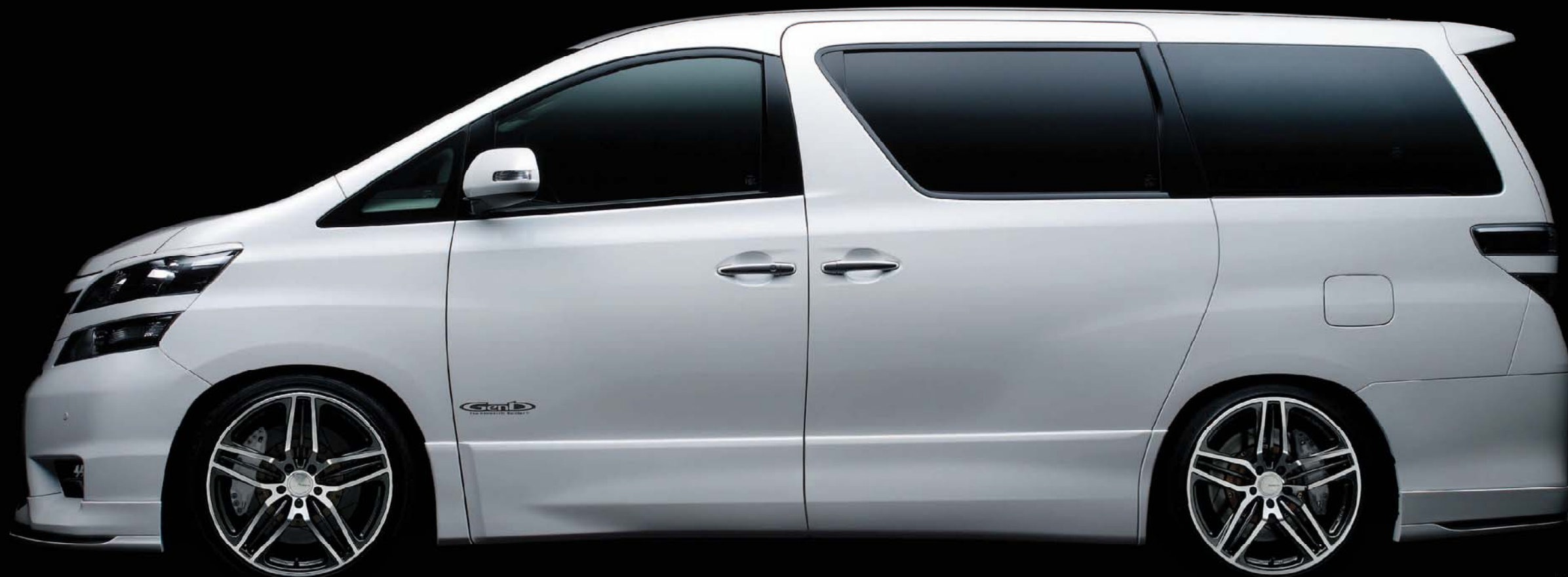
TOMMYKAIRA JAPAN VELLFIRE (F)2085 INSET 38 (R)2095 INSET 38