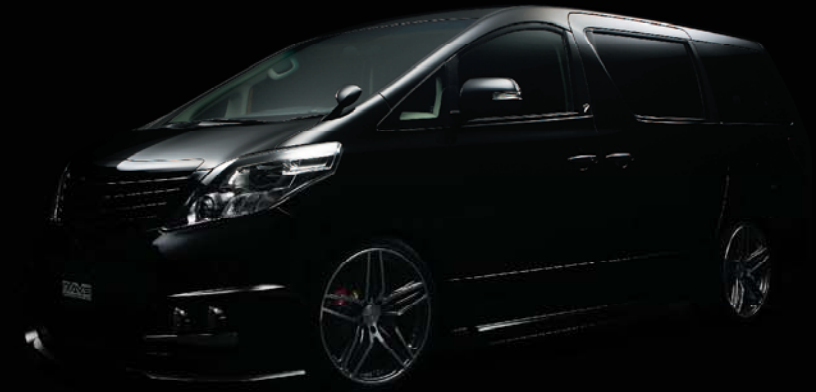
WALD ALPHARD (F)2085 INSET 38 (R)2095 INSET 38