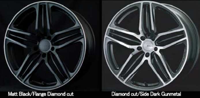
Matt Black/Flange Diamond cut